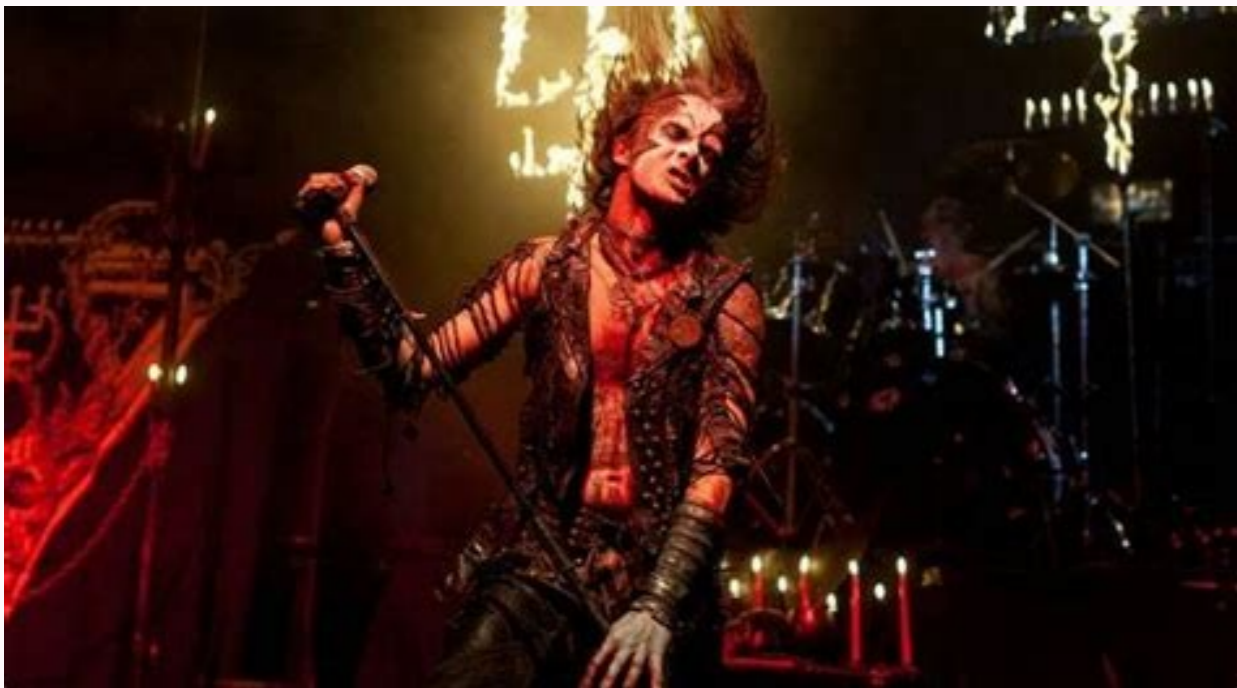
Simbolos satanicos en el vaticano. Signos satanicos en el vaticano.